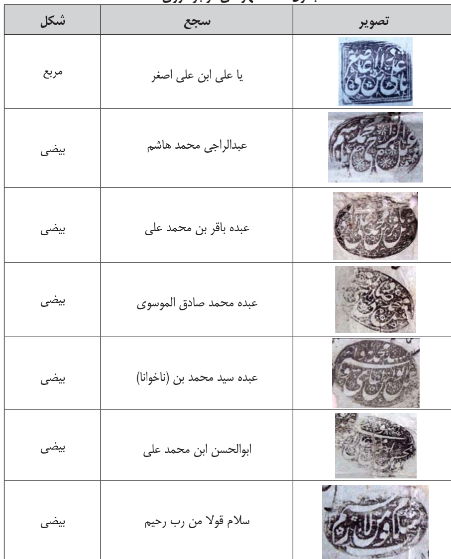
جدول ۱-۱: مهرهای موجود روی سند